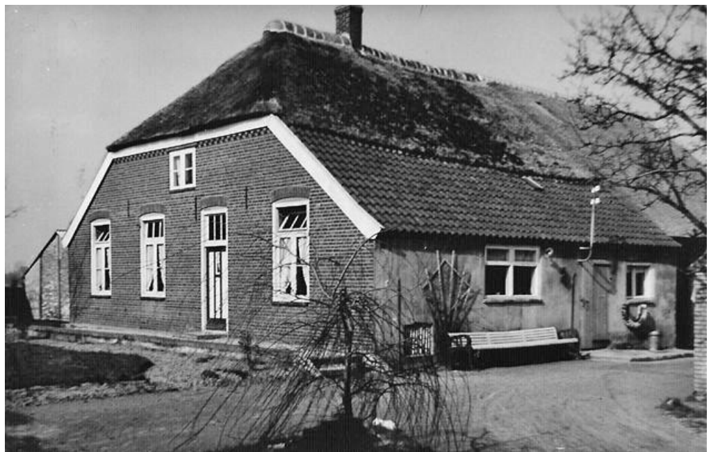
Bloemershof circa 1955.