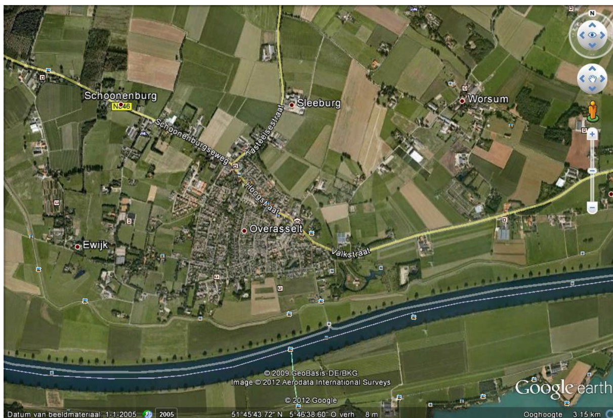
2012 Overasselt & Worsum