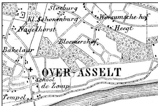
Kaart uit 1867 met Bloemershof op de kruising van de Worsumseweg en een dwarsweg die de Garstkampsestraat verbindt met de Valkstraat.

Waar komt de naam 'Bloemershof' vandaan? Waarschijnlijk betekent het de hof van Bloemers.