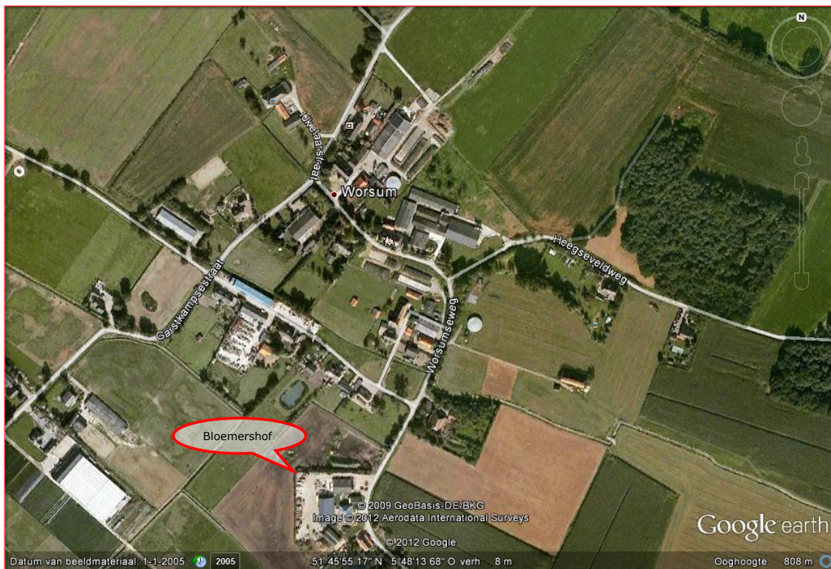
2012 Worsum nabij Overasselt