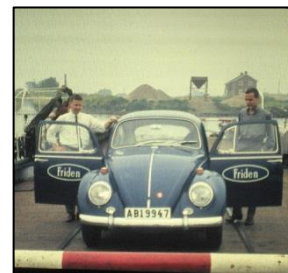
Foto's Friden Oslo

In Nijmegen aan de Sint Theunismolenweg was een van de fabrieken gevestigd, na het vertrek uit Wageningen.