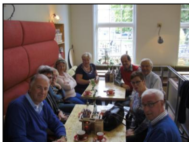
In de Kazeme