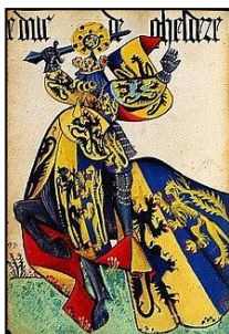
Reinoud IV te paard, met gespiegeld wapen en dekkleed.

Samen met de Wittelsbachers poogde hij tevergeefs de invloed van Bourgondië in de Nederlanden af te zwakken. Zijn poging in 1406 om aanspraak te maken op Brabant en Limburg mislukte. Reinoud verbond zich met Rooms-koning Ruprecht en had ook goede relaties met het huis van Orléans. Hij steunde Johan van Arkel in zijn strijd tegen Holland en kreeg daarvoor Gorinchem. Hierdoor barstte opnieuw strijd los tegen Holland, hetgeen ermee eindigde dat Holland Gorinchem afkocht voor een belangrijke som geld. Ook de stad Emmerik moest Reinoud op basis van vroegere afspraken afstaan aan Kleef. Wegens zijn omvangrijke schulden moest hij de standen steeds meer privileges en medebestuur toestaan.