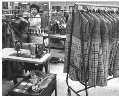
Confectieatelier Hollandia Kievit, tijdens de productie van jassen.

Na Multisol bevinden de gebouwen van voormalig Smit Welt met een eigen achteringang. De hoofdingang is aan de Groenestraat.