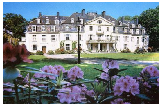
Kasteel Pesch anno 2011 (nabij Krefeld, Nordrhein-Westfalen) Schlossstrase 40670 Meerbuch - Duitsland