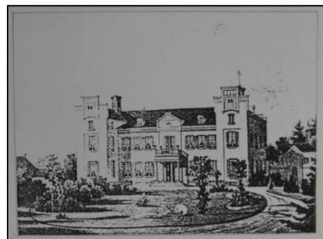
HAvezathe Pesch na 1840.